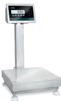
PIATTAFORMA DI PESATURA

Le bilance HYGIENX sono prodotte in Italia e costruite in acciaio INOX con saldature continue per resistere ai lavaggi ad alta pressione e ad alta temperatura necessari nelle strutture sanitarie con alti requisiti di igiene. Il loro design è studiato per evitare l'accumulo di acqua o materiali negli angoli più critici, riducendo il rischio di proliferazione batterica. La superficie in acciaio lucidato consente ai detersivi e all'acqua di defluire dalle bilance HYGIENX dopo il lavaggio.