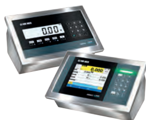
INDICATORI DI PESO